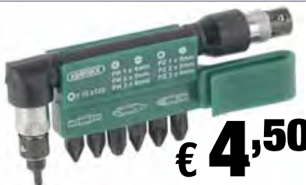
Supporto angolare per bits 90° - 8 pezzi - Completo di 6 bits doppi: PH 1x4 mm, PH 2x5 mm, PH 3x6 mm, PZ 1x4 mm, PZ 2x5 mm, PZ 3x6 mm, T 15 x T 20 Art: 113790