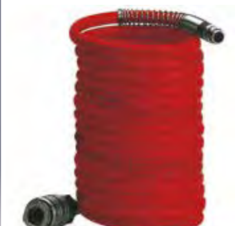
Tubo a spirale