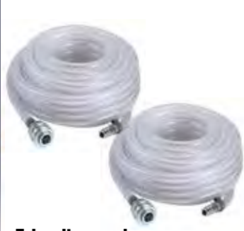
Tubo alta pressione