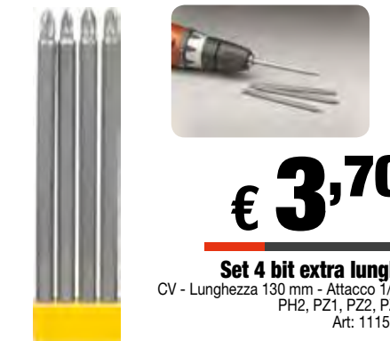
Set 4 bit extra lunghi CV - Lunghezza 130 mm - Attacco 1/4" PH2, PZ1, PZ2, PZ3 Art: 111500