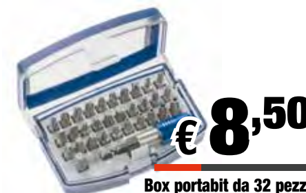
Box portabit da 32 pezzi Cromo Vanadio - Clip per cintura - Supporto rapido magnetico 1/4" adattatore 1/4" PH1, 2 X PH2, PH3 PZ12 X PZ2, PZ3 Taglio 3, 4, 5, 6 mm - Esagonale 3, 4, 5, 6 mm Torx 10, 15, 20, 25, 27, 30, 40 ResisTorx 10, 15, 20, 25, 27, 30, 40 Art: 118490