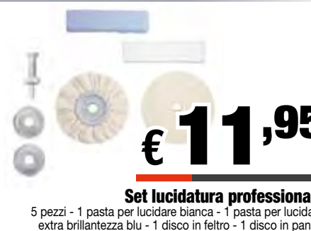
Set lucidatura professionale 5 pezzi - 1 pasta per lucidare bianca - 1 pasta per lucidare extra brillantezza blu - 1 disco in feltro - 1 disco in panno 1 mandrino Art: 485200