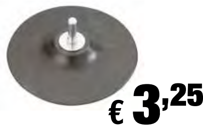
Platorello in gomma con attacco mandrino Per trapani - Ø 125 mm - attacco 8 mm Art: 483500