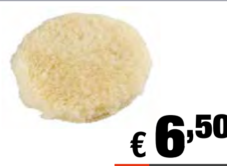
Cuffia in pelo d'agnello Ø 125 mm - Per platorelli 115x125 mm Art: 484600