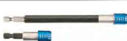
Supporto magnetico per bit a cambio rapido 2 pz - CV - Attacco esagonale 1/4" con molla 1x150 mm - 1x60 mm Art: 100790