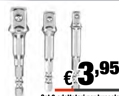
Set 3 adattatori per bussole CV - 3 pz - Attacco esagonale 1/4" - 3/8" - 1/2" Art: 105300