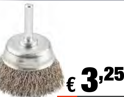
Spazzola a tazza Ø 75 mm filo d'acciaio arricciato grezzo Attacco 6 mm - Ø filo 0,30 m Art: 606330