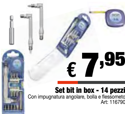
Set bit in box - 14 pezzi Con impugnatura angolare, bolla e flessometro Art: 116790