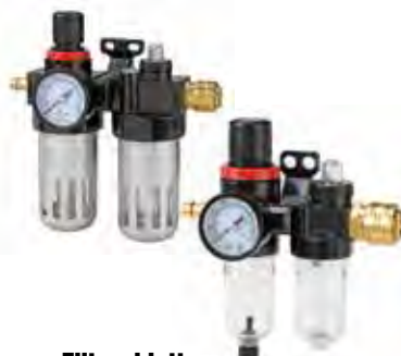
Filtro riduttore Con lubrificatore