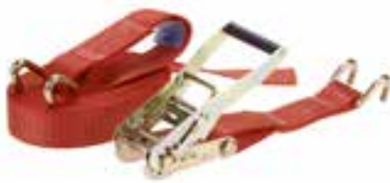
Cinghia con tirante a cricchetto e due ganci Poliestere (PES)

6 m x 35 mm - 2.000 daN (Kg) Art: 773296