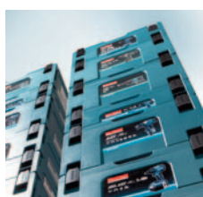
Dotate di maniglione di trasporto a scomparsa e compatibili con altre valigette impilabili