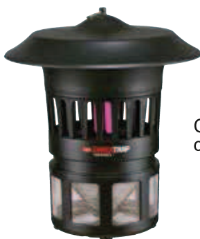
Colore NERO cod. H016