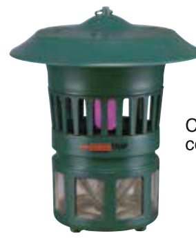
Colore VERDE cod. H015