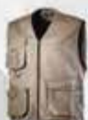
col.25070 beige beige