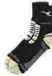
col.C4699 nerolgrigio noirlgris