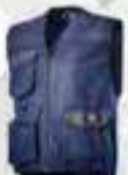
col.60062 blu classico bleu classique