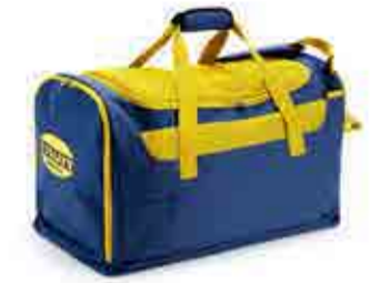
col.C5876 blu/giallo bleu corsair/jaune

Canvas: 100% Polyester Mesh: 100% Polyester