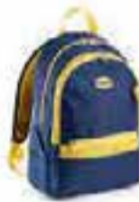
col.C5876 blu/giallo bleu corsair/jaune