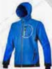
col.60084 blu micro micro bleu