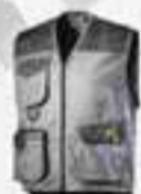
col.75070 grigio acciaio gris métal