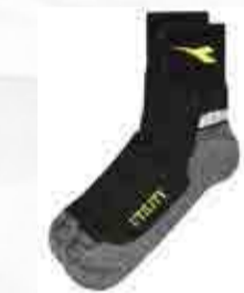
col.C4699 nerolgrigio noirlgris