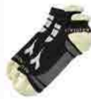
col.C4699 nerolgrigio noirlgris