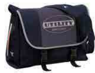
col.60063 blu corsaro bleu foncé

Canvas: 100% Polyester Mesh: 100% Polyester