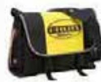
col.80013 nero noir