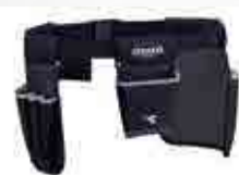
col.60063 blu corsaro bleu foncé