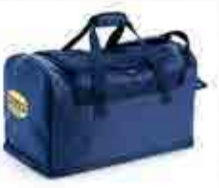
col.60063 blu corsaro bleu foncé