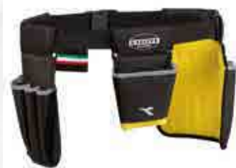
col.80013 nero noir

Canvas: 100% Polyester Mesh: 100% Polyester