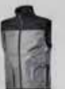
col.75047 grigio pioggia gris ciel