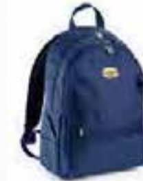
col.60063 blu corsaro bleu foncé

Canvas: 100% Polyester Mesh: 100% Polyester