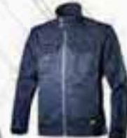
col.60062 blu classico bleu classique